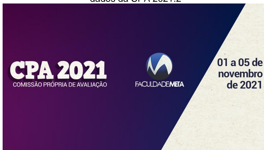
Imagem 03 – Banner utilizado na página do Google Forms para coleta de dados da CPA 2021.2